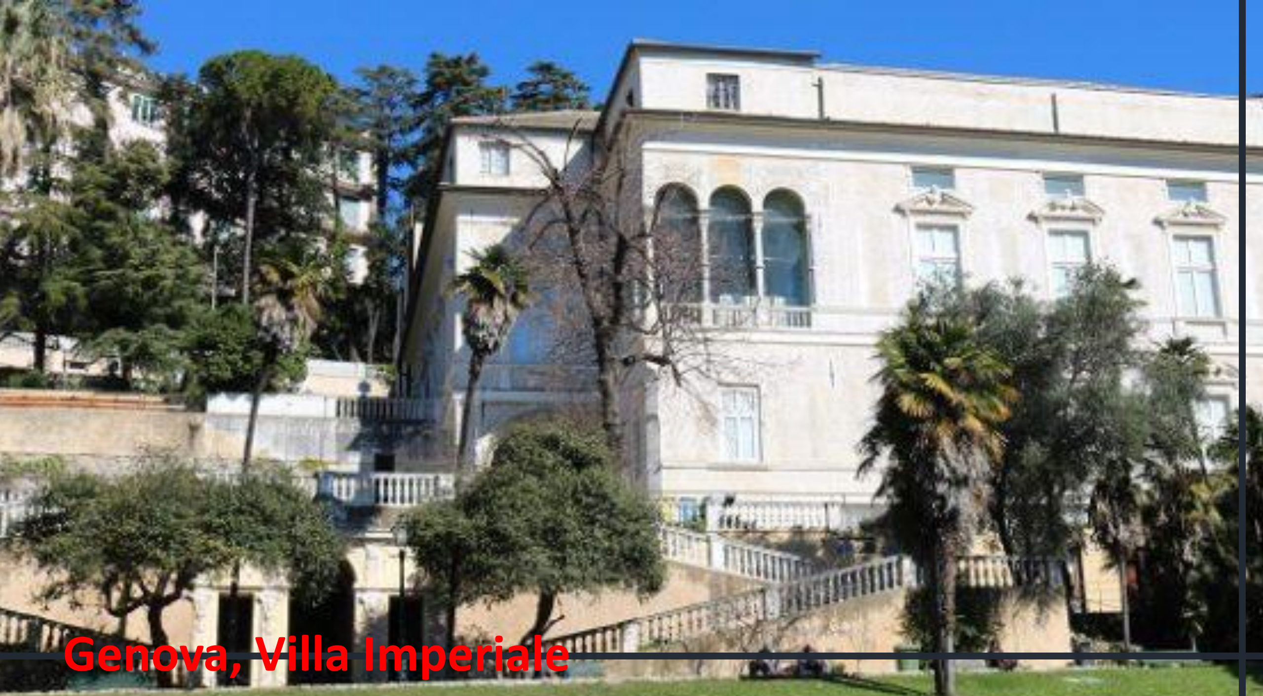
Genova, Villa Imperiale