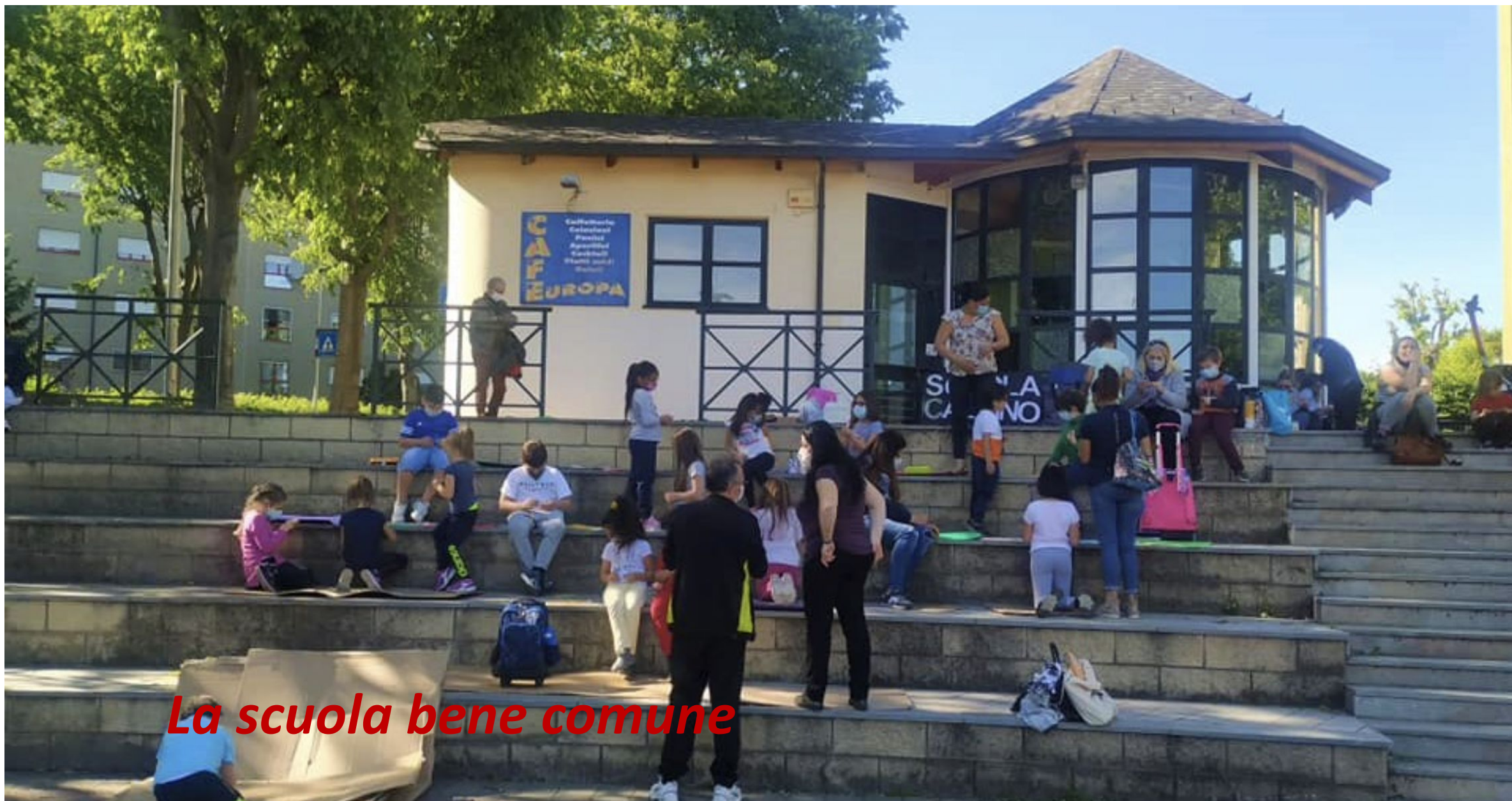
La scuola bene comune