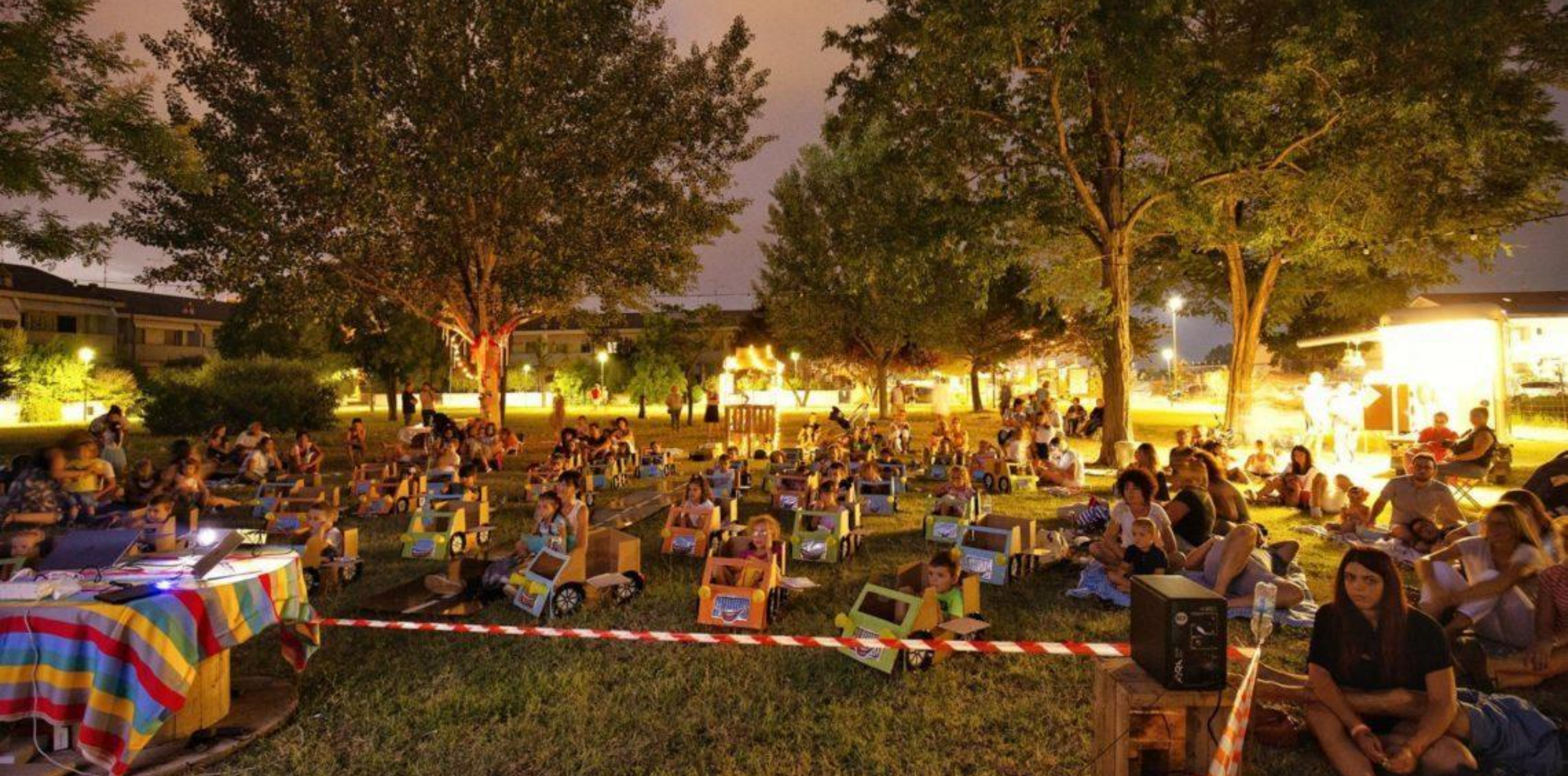
Cesena, progetto Green City